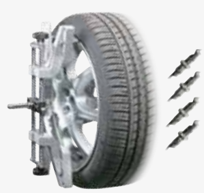
● 10-26" professional bracket Soporte autocentrante 10-26" profesional