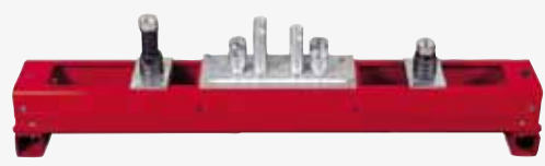
Multilink bar for: VW - Audi - Skoda - Barra multilink para: VW - Audi - Skoda