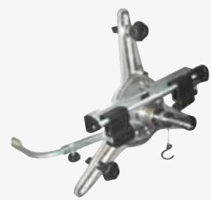
● 9-21" quick wheel clamp Soporte rápido 9 - 21"