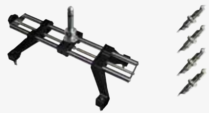
● 10-21" car bracket and 17,5-25" truck bracket Soporte 10-21" coche y 17,5-25 camión